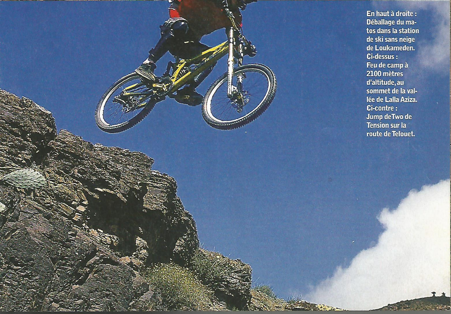
En haut à droite : Déballage du matos dans la station de ski sans neige de Loukameden. Ci-dessus : Feu de camp à 2100 mètres d'altitude, au sommet de la vallée de Lalla Aziza. Ci-contre : Jump deTwo de Tension sur la route de Telouet.